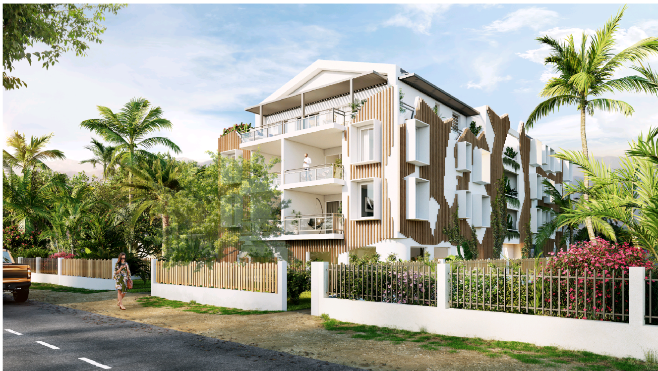
Vue depuis le boulevard Front de Mer - Saint Paul Image non contractuelle